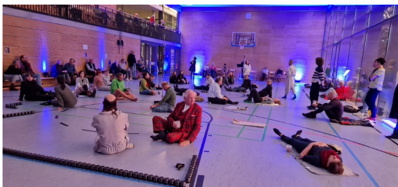
Зураг 1: Энэхүү зураг нь 2023 оны 10-р сарын 21-нд Донауэшингений хөгжмийн өдрүүдийн үеэр Войтек Блечарзын 3-р симфони тоглолтын үеэр ханхүү болон түүний уран бүтээлчийн хамт авсан болно.

Донауэсшинген хот нь санхүүгийн дэмжлэг болон материаллаг эх үүсвэрээр төсвийн 13% -ийг бүрдүүлж, арга хэмжээг ихээхэн дэмжиж байна. Баден-Вюртемберг муж болон Холбооны Соёлын сан тус бүр төсвийн 30-аас доош хувийг хангадаг нь наадамд үнэнч байгаагаа харуулж байна. Нэмж дурдахад төсвийн 10 орчим хувийг тасалбар борлуулах замаар оролцогчид өөрсдөө гаргадаг. Засгийн газар болон төрөл бүрийн орон нутгийн бизнес эрхлэгчид, наадамд оролцогчдын хамтын хүчин чармайлт нь хамгийн алслагдсан бүс нутагт ч гэсэн ийм хэмжээний соёлын арга хэмжээг амжилттай зохион байгуулж буй нь Германы соёлын федерализмын үр нөлөөг харуулж байна.