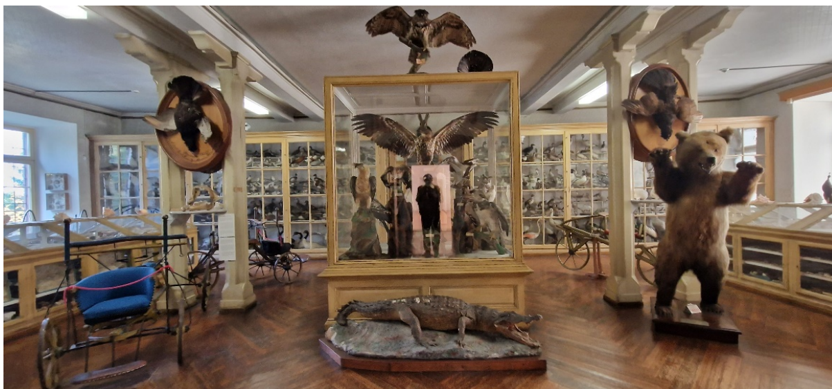
Зураг 3: Донауэсшинген дэх хунтайж Фюрстенбергийн цуглуулгуудыг харуулсан. Зүүн талд байгаа зураг нь 1820 онд Карл фон Драйсын бүтээсэн, дэлхийн цорын ганц амьд үлдсэн "DREIRÄDRIGE LAUFMASCHINE" (Гурван дугуйт хөлт тэрэг)-ийг харуулж байна. Зургийг Маттиас Теодор Фогт Горлиц.