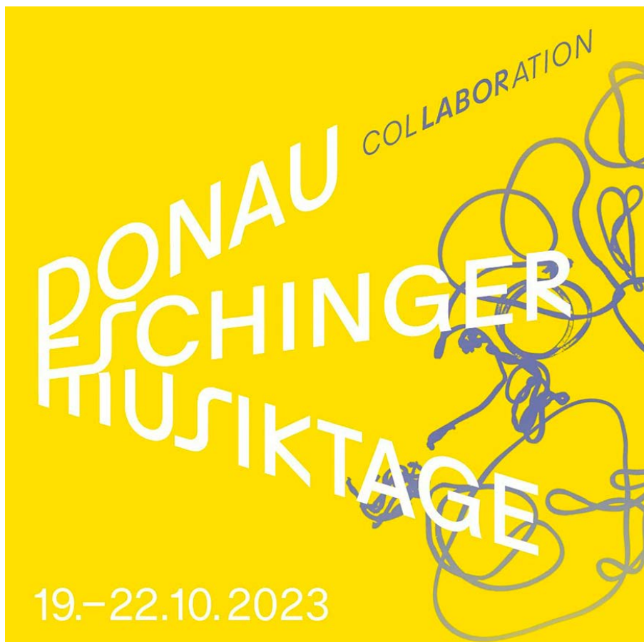
ЗУРАГ 8: ХАМТЫН АЖИЛЛАГАА. DONAUESCHINGEN ХӨГЖМИЙН ӨДРҮҮДИЙН ПОСТЕР 2023. SWR