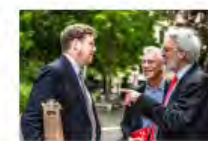
Kulturpolitik24Mai2024Görlitz_IKS30-SächsKRG30-WK2 7_PhotoZgraja_16 Hummel-Erfurt-Vogt 4L1...