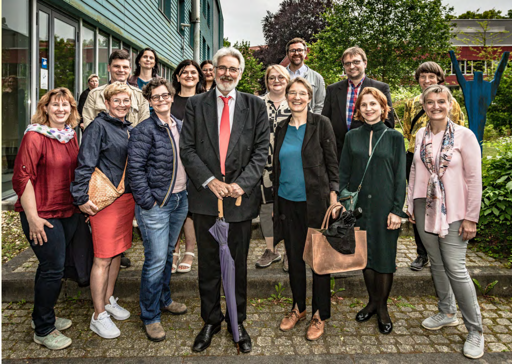
Absolventen des ersten Jahrgangs „Kultur und Management“ Görlitz (WK 1997)