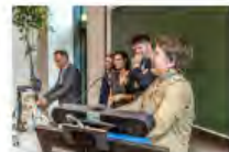
Kulturpolitik24Mai2024Görlitz_IKS30-SächsKRG30-WK2 7_PhotoZgraja_21 Franke und Diskussion 4L1A0387...