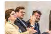
Kulturpolitik24Mai2024Görlitz_IKS30-SächsKRG30-WK2 7_PhotoZgraja_25 Franke Hummel Zenker 4L1A037...