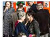
Kulturpolitik24Mai2024Görlitz_IKS30-SächsKRG30-WK2 7_PhotoZgraja_12 Grossmann-VogtFrank 4L...