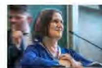
Kulturpolitik24Mai2024Görlitz_IKS30-SächsKRG30-WK2 7_PhotoZgraja_24 Zinke 7Y0A5152-76.jpg