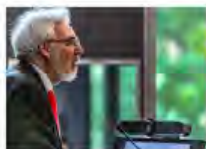
Kulturpolitik24Mai2024Görlitz_IKS30-SächsKRG30-WK2 7_PhotoZgraja_18 Vogt 4L1A0253-Verbessert-RR-...