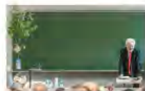
Kulturpolitik24Mai2024Görlitz_IKS30-SächsKRG30-WK2 7_PhotoZgraja_20 Abschied von der Lehre V...