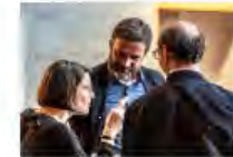
Kulturpolitik24Mai2024Görlitz_IKS30-SächsKRG30-WK2 7_PhotoZgraja_14 Weise 4L1A0459-Verbessert-RR-...