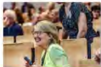
Kulturpolitik24Mai2024Görlitz_IKS30-SächsKRG30-WK2 7_PhotoZgraja_28 Rommel 4L1A0363-Verbessert-RR-...