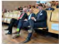
Kulturpolitik24Mai2024Görlitz_IKS30-SächsKRG30-WK2 7_02 Meyer Zenker Vogt_PhotoLandratsamt ...