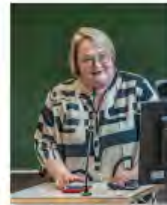
Kulturpolitik24Mai2024Görlitz_IKS30-SächsKRG30-WK2 7_PhotoZgraja_05 Sedleniece 4L1A0148-Ver-...