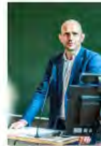
Kulturpolitik24Mai2024Görlitz_IKS30-SächsKRG30-WK2 7_PhotoZgraja_04 Meyer 4L1A0131-Verbessert-RR-...