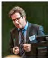
Kulturpolitik24Mai2024Görlitz_IKS30-SächsKRG30-WK2 7_PhotoZgraja_09 Garsztecki 4L1A0196-Verb-...