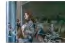
Kulturpolitik24Mai2024Görlitz_IKS30-SächsKRG30-WK2 7_PhotoZgraja_08 Rozanka 7Y0A4957-44.jpg