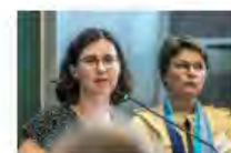
Kulturpolitik24Mai2024Görlitz_IKS30-SächsKRG30-WK2 7_PhotoZgraja_22 Jacobs Franke 7Y0A5171-78.jpg