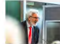
Kulturpolitik24Mai2024Görlitz_IKS30-SächsKRG30-WK2 7_PhotoZgraja_17 VogtF CwiklaG 4L1A0259-Verbessert-RR-...