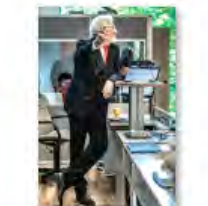
Kulturpolitik24Mai2024Görlitz_IKS30-SächsKRG30-WK2 7_PhotoZgraja_19 Vogt 4L1A0360-66.jpg