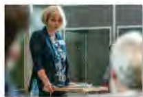
Kulturpolitik24Mai2024Görlitz_IKS30-SächsKRG30-WK2 7_PhotoZgraja_10 Pfeil 7Y0A5015-51.jpg