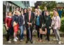
Kulturpolitik24Mai2024Görlitz_IKS30-SächsKRG30-WK2 7_PhotoZgraja_01 Studiengang 1997WK-Vo...