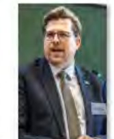
Kulturpolitik24Mai2024Görlitz_IKS30-SächsKRG30-WK2 7_PhotoZgraja_32 Hummel Schlußwort 7Y0A5231-87...