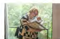
Kulturpolitik24Mai2024Görlitz_IKS30-SächsKRG30-WK2 7_PhotoZgraja_31 Sedlenice mit Geschenk ...