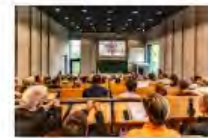
Kulturpolitik24Mai2024Görlitz_IKS30-SächsKRG30-WK2 7_PhotoZgraja_06 Kimura 4L1A0155-Verbessert-RR-...