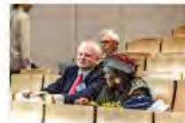
Kulturpolitik24Mai2024Görlitz_IKS30-SächsKRG30-WK2 7_PhotoZgraja_30 Liebig Esperance 4L1A0318-60.jpg