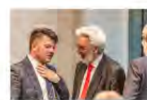
Kulturpolitik24Mai2024Görlitz_IKS30-SächsKRG30-WK2 7_PhotoZgraja_15 Zenker-Vogt-Hummel 4L...