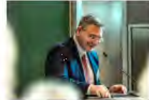
Kulturpolitik24Mai2024Görlitz_IKS30-SächsKRG30-WK2 7_PhotoZgraja_11 Ferrara 4L1A0236-Verbessert-RR-...