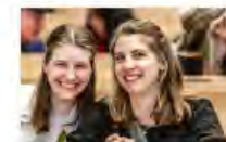
Kulturpolitik24Mai2024Görlitz_IKS30-SächsKRG30-WK2 7_PhotoZgraja_26 VogtF CwiklaG 4L1A0344-Verbe-...