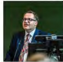
Kulturpolitik24Mai2024Görlitz_IKS30-SächsKRG30-WK2 7_PhotoZgraja_03 Kratschsch 4L1A0122-Verbessert-RR-...