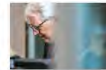
Kulturpolitik24Mai2024Görlitz_IKS30-SächsKRG30-WK2 7_PhotoZgraja_07 Vogt-Spira 7Y0A4865-23.j...