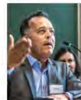
Kulturpolitik24Mai2024Görlitz_IKS30-SächsKRG30-WK2 7_PhotoZgraja_23 Sodann 7Y0A5201-83.jpg