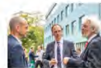
Kulturpolitik24Mai2024Görlitz_IKS30-SächsKRG30-WK2 7_PhotoZgraja_13 Meyer Schaauf-Schuchardt Vogt ...