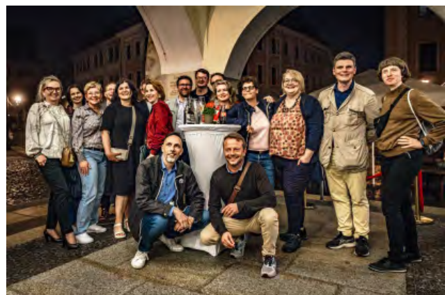
Das Kunstfest endete mit einem Lied von 21 ehemaligen UNESCO-Studenten "Kultur und Management" (Jahrgang 1997), die in lettischer, polnischer, sorbischer, tschechischer und deutscher Sprache gratulierten.