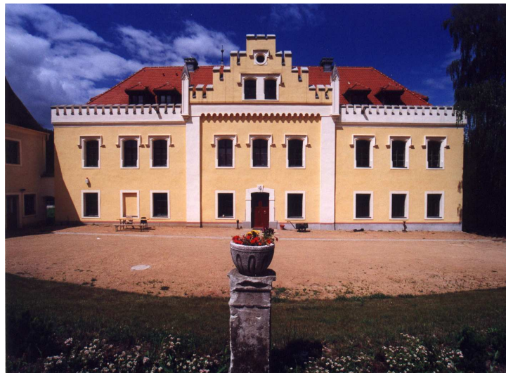
Schloß Klingewalde bei Görlitz. Veranstaltungsort des Forschungskollegs

Nach innen eröffnet das Collegium seinen Teilnehmern durch die gemeinsame Arbeit in multinationalen und interdisziplinären Teams die Möglichkeit, die Europäisierung des Alltags gleichzeitig theoretisch zu thematisieren und als Lebenspraxis zu erfahren. Die Sommerakademie ist zwar ergebnisorientiert, nichtsdestoweniger ist die Form selbst ein wichtiges Lernziel: Dadurch soll die Erfahrung von Solidarität und Gemeinschaft vermittelt werden, wie es auf der politischen Ebene der Europäischen Union angestrebt wird. Es entstehen daneben immer neue Netzwerke, die auch über den jeweiligen Projektverlauf hinaus Wirkung entfalten.